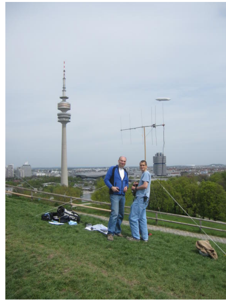
Abb. 3: QRV auf dem Olympiaberg

eigentlichen Start bewegten sich nun alle auf eine nahe liegende Wiese, um nicht zu riskieren, daß der Ballon beim Start in den Bäumen hängen bleibt. Was nun noch fehlte, war die Startfreigabe.