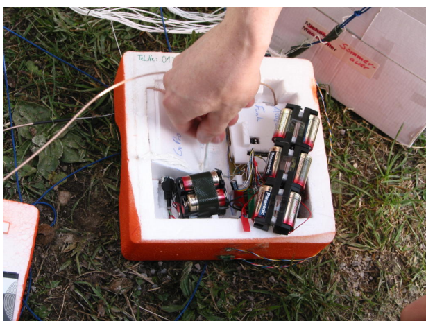
Abb. 1: Innenansichten