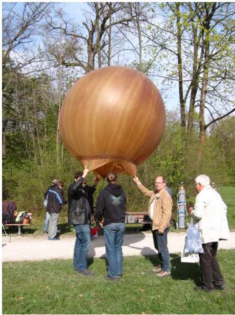
Abb. 2: Startvorbereitungen